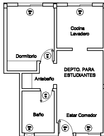
DEPARTAMENTO 1 DORMITORIO